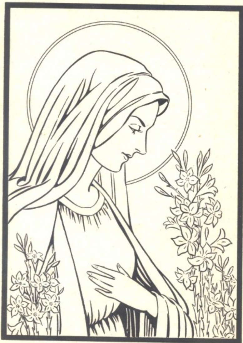
Vierge très pure, priez pour nous.

« Mon bon Jésus, je regrette de vous avoir offensé parce que vous êtes si bon, si beau, si grand ! »